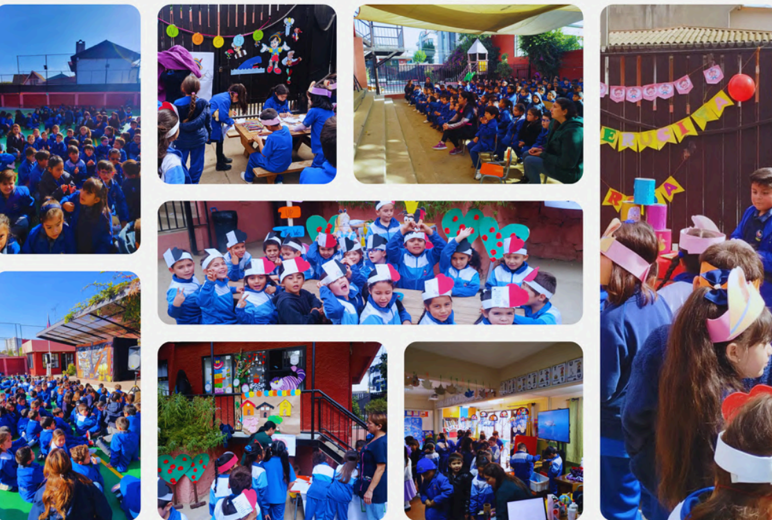
Fotografías tomadas por las profesoras del ciclo de enseñanza en distintas actividades realizadas durante el año.

El primer ciclo de enseñanza (que abarca desde el nivel NTI hasta segundo básico) se vive con un profundo compromiso hacia el desarrollo de los estudiantes. Cada profesora que acompaña esta etapa entiende que la niñez es mucho más que un período de aprendizaje escolar: